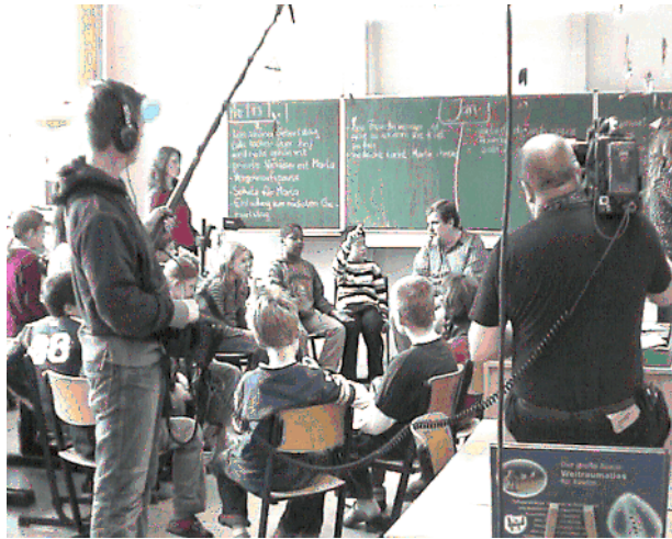
<4. Klasse Studierende>