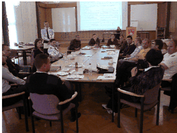
<Offiziere der BW Gefangene>